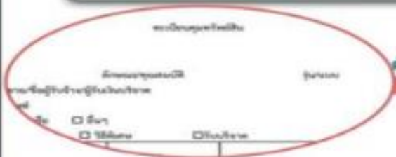
ตัวอย่างทะเบียนคุมทรัพย์สิน

-ลงทะเบียนคุมทรัพย์สินตามแบบที่ กวพ.กำหนด -ลงข้อมูลในระบบ POLIS